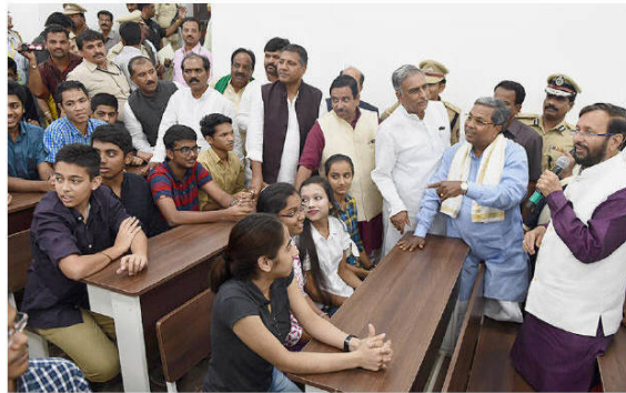
Union Minister Prakash Javadekar and CM Siddaramaiah at IIT-Dharwad on Sunday.

Mr. Javadekar said the government was committed to promoting growth of higher education with a thrust on research. Access to higher education alone could put